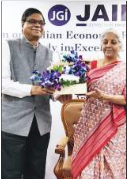
वित्त मंत्री निर्मला सीतारमण एक कार्यक्रम में हिस्सा लेती हुई।